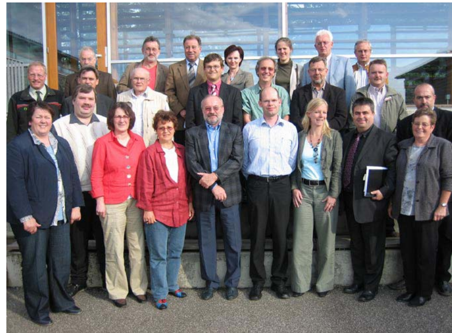
Abbildung 2: Mitglieder der LAG Hunsrück

Die LAG Hunsrück hat keine eigene Rechtsform, allerdings ist ein ordnungsgemäßes Funktionieren der Partnerschaft sowie eine Umsetzung der Entwicklungsstrategie gemäß dem Bottom-up-Prinzip durch die Beauftragung des „Regionalrats Wirtschaft Rhein-Hunsrück e.V.“ als eingetragenen Verein mit Erfahrungen aus zwei bereits abgeschlossenen Förderperioden gesichert.