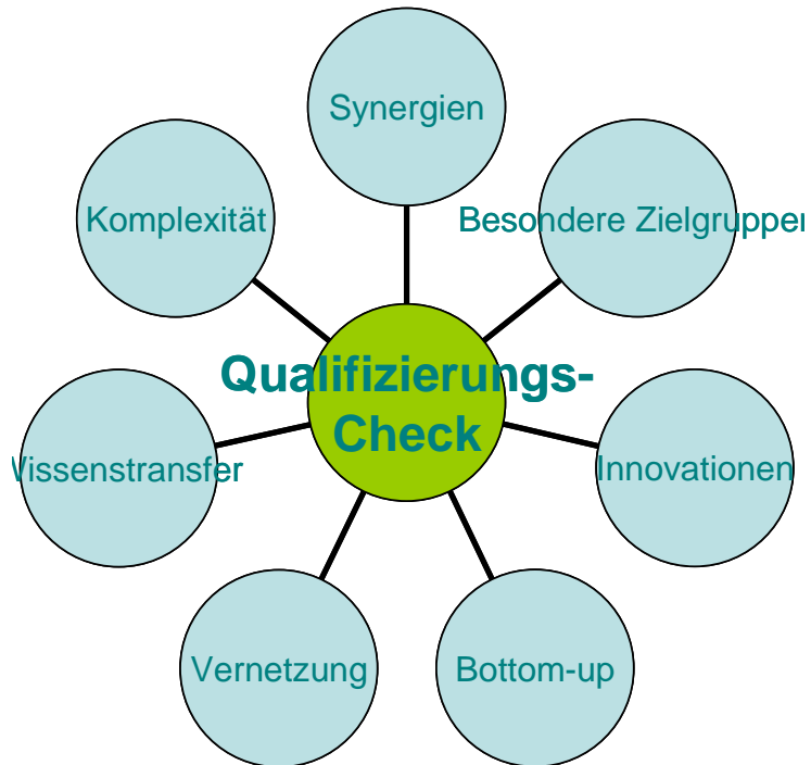
Abbildung 4: Qualifizierungs-Check

Sie hilft aber auch der LAG bei der Entscheidung, welcher Projektantrag gegebenenfalls vorzuziehen ist. Dabei sollte das Verfahren nur als Diskussionsgrundlage dienen, da die LAG in begründeten Fällen durchaus andere Wertungen und Gewichtungen vornehmen kann als es das Verfahren vorsieht.