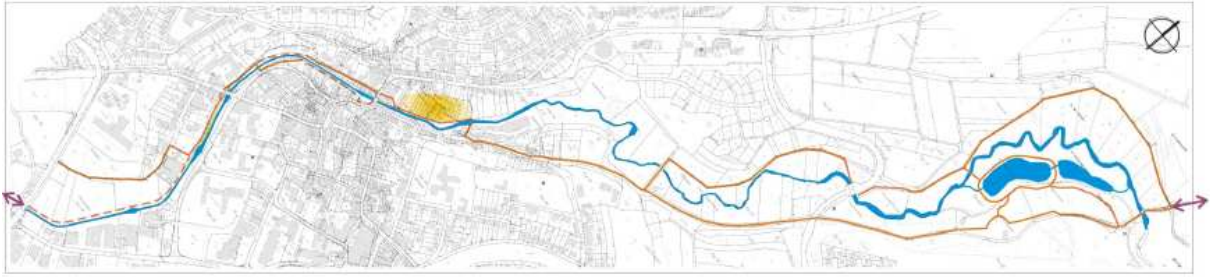
Lage des Plangebietes auf dem Verlauf der „innerstädtischen“ Simmerbachau